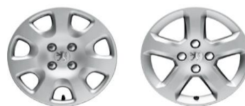
ДЕКОРАТИВНЫЕ КОЛПАКИ АТАСАМА 15" (Access)